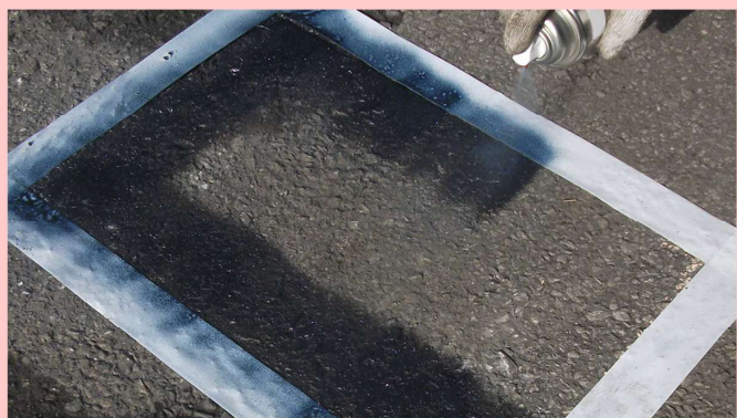
②…端部は厚めに吹き付けます