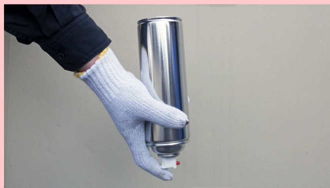
④…使用後は空吹きしてください